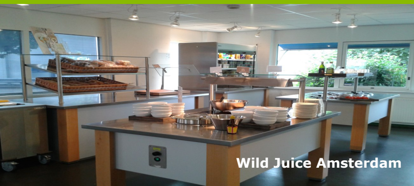
Wild Juice Amsterdam